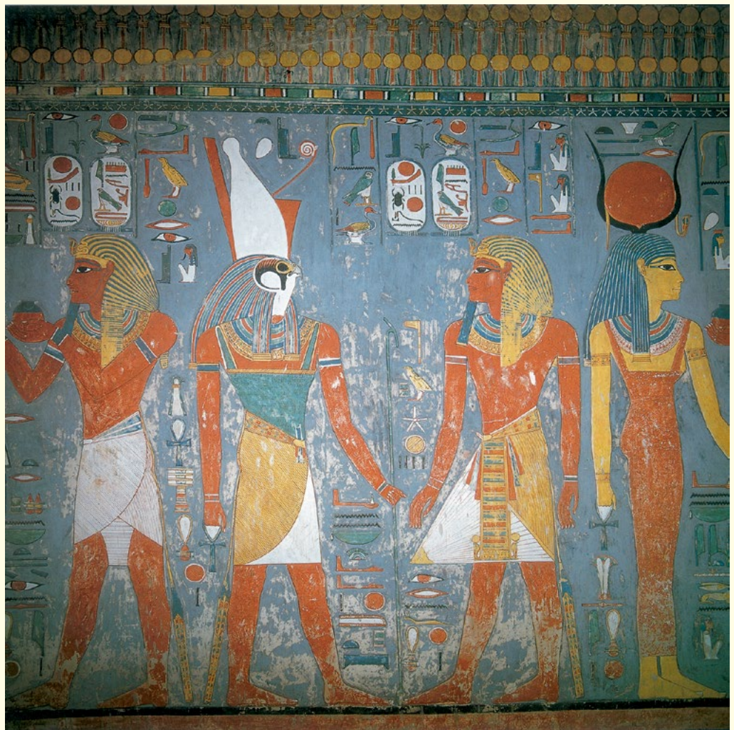
האל הורוס, בעל ראש הברד, נושא את הכתר של מצרים העליונה ושל מצרים התחתונה. מולו עומד המלך חורמחב. ציור קיר מקברו של המלך חורמחב בעמק המלכים שבמצרים

איחוד מצרים חלש המלך על ממלכה ענקית שהשתרעה מן האשד הראשון של נהר הנילוס בדרום ועד לדלתה של הנילוס בצפון. המלך המצרי פרש את חסותו על פולחן כל האלים, והוא עצמו נחשב אל והיה מושא פולחן בכל אחד ממקדשי האלים הרבים.