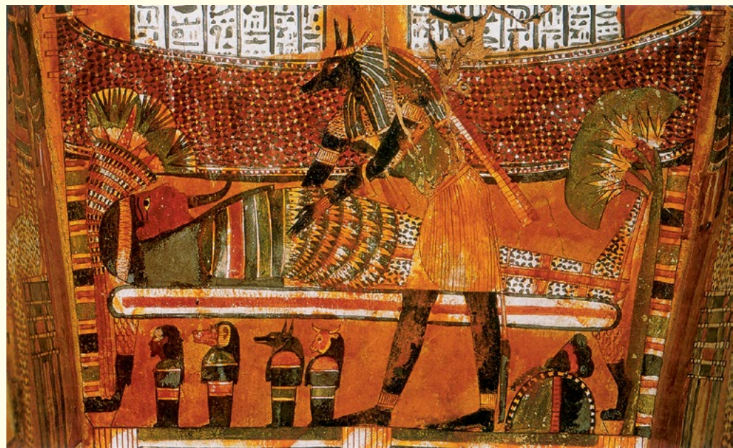
הכנה לקבורה של כוהן אמון מתבני. הניסיון לשמר את הגוף מלמד על החשיבות שייחסו לו המצרים בתהליך ההינולדות מחדש אחרי המוות ולקיום הנאות בעולם המתים

בתהליך כינון הממלכה המצרית המאוחדת בסוף האלף הרביעי לפני הספירה, לפני כחמשת אלפים שנה. בסופו של תהליך זה היה המלך החי עם הורוס קשור בקרבת המת בחדר הקבורה.